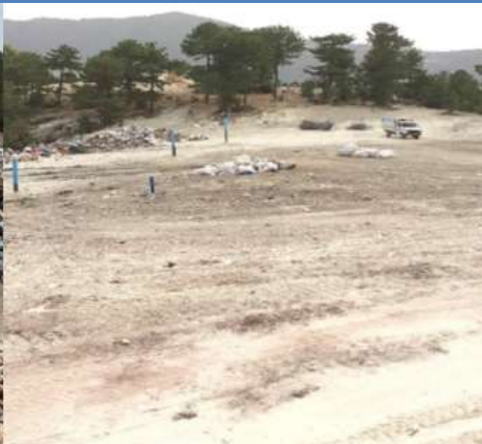
Una discarica aperta prima e dopo l'intervento di riabilitazione (Cameli, Denizli, Turchia)